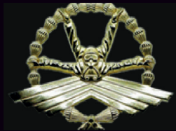
Brevet Free Fall TNI AD