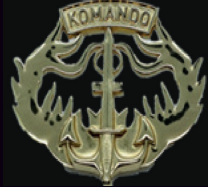
Brevet Kualifikasi Komando Kpassus