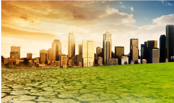
Potensi Konflik Bersenjata di Laut Natuna Utara