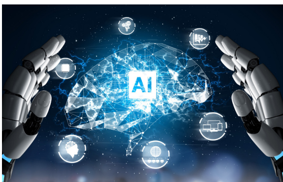
Disrupsi Kecerdasan Buatan