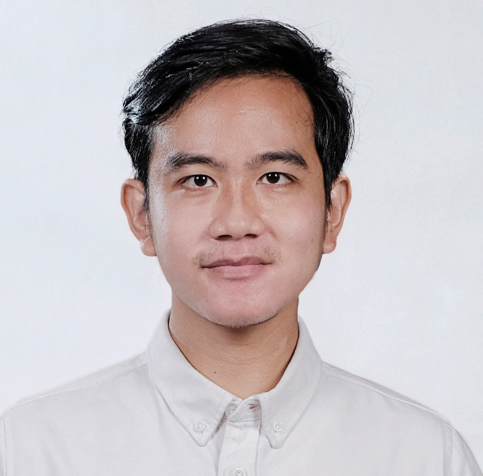
Gibran Rakabuming Raka, lahir 1 Oktober 1987