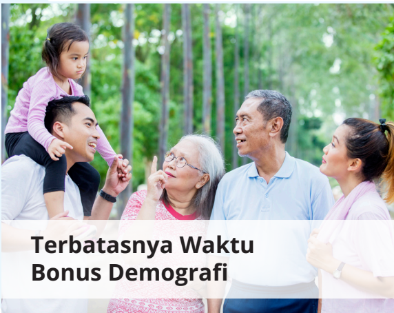
Terbatasnya Waktu Bonus Demografi