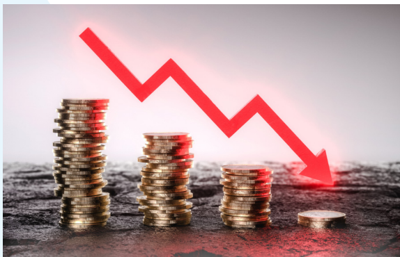
Perlambatan Ekonomi Global